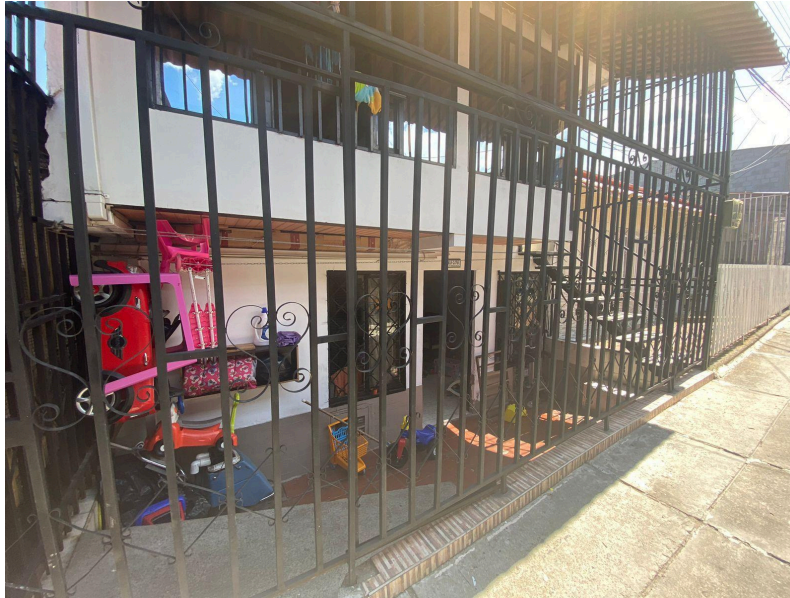
Imagen 2 Registro fotográfico a predio informal 63-001-01-01-0000-0626-0035-5-00-00-0006 realizada el día 29 de agosto de 2024

en condición de informalidad está fuera por fuera del límite del terreno, por lo cual es IMPROCEDENTE.