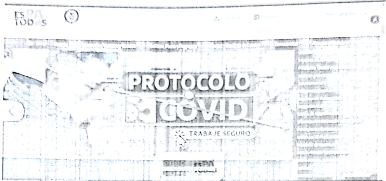
Ilustración 23 canal de Atención - https://www.armenia.gov.ge/politicas-planes-y-programas/participacion-ciudadana

Este canal cuenta con una estación que permite que la ciudadanía interponga peticiones quejas y reclamos, un espacio de servicios de atención en línea en donde se encuentran las siguientes opciones: