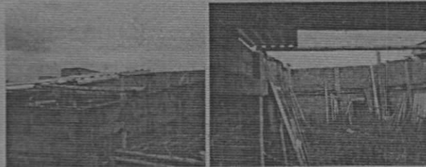
Registro fotográfico del día 13 de noviembre del 2021

En atención a la solicitud recibida en la Subsecretaria de catastro Armenia, radicada bajo los números de la referencia, donde solicita incorporación del bien inmueble localizado en la Urbanización Marbella, me permito informar que revisada la documentación aportada y de acuerdo el informe de visita a terreno realizada el día 23 de noviembre del 2021, no se encontró construcción alguna sobre el lote objeto de requerimiento.