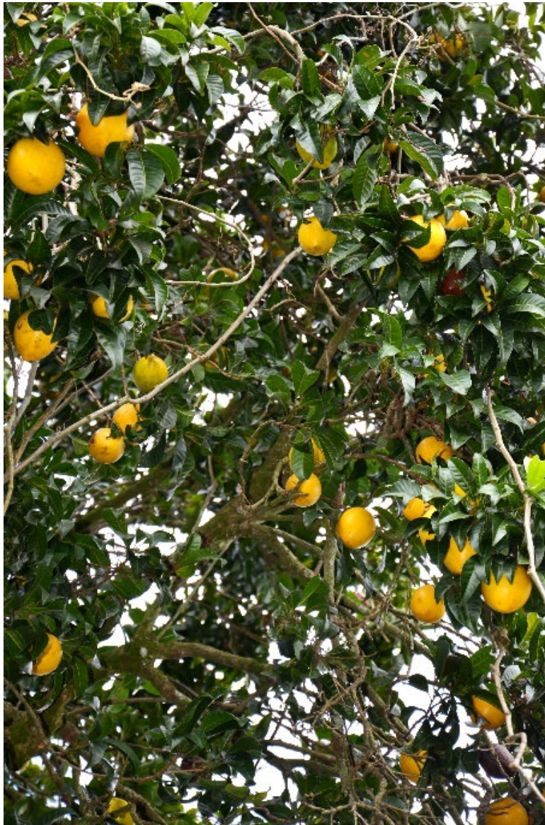
Frutos del árbol de Caimo, por el cual recibió el nombre el Corregimiento